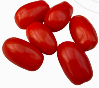
Tomate Cherry pera ROJO