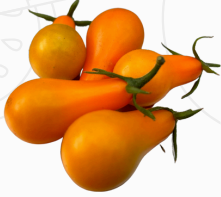
Tomate Cherry OPERINO