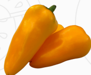
Mini Pimiento AMARILLO