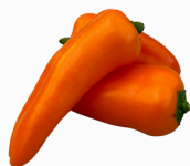
Mini Pimiento NARANJA