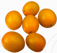
Tomate Cherry Coctel AMARILLO