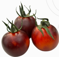
Tomate YOOM Negro