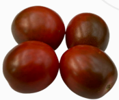
Tomate Mini KUMATO