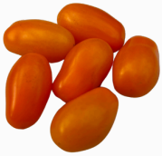
Tomate Cherry pera NARANJA