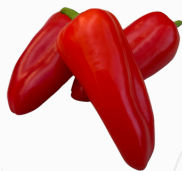
Mini Pimiento ROJO