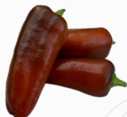
Mini Pimiento CHOCOLATE